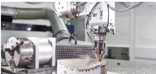
Die hier gezeigte LMD-Technologie eignet sich in der Luft- und Raumfahrt für die Reparatur großer Bauteile. (Quelle: TRUMPF / Claus Morgenstern).