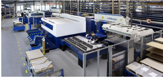
Die Maschinendatenerfassung ist eine wichtige Grundlage des Shopfloor-Managements bei WECUBEX. Beides zusammen hat dem Unternehmen im Jahr 2017 eine rund 10-prozentige Produktivitätssteigerung gebracht.“