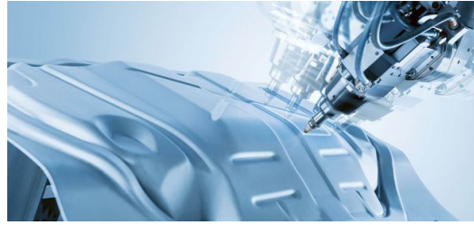
EdgeLine Bevel ermöglicht Fasen, die Ablagerungen an den Rändern der Schweißnaht verhindern. Dadurch verlieren die Bauteile Gewicht.