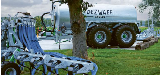
Durch die spaltfreie Schweißnaht eignet sich EdgeLine Bevel ideal für Anwendungen im Freien.