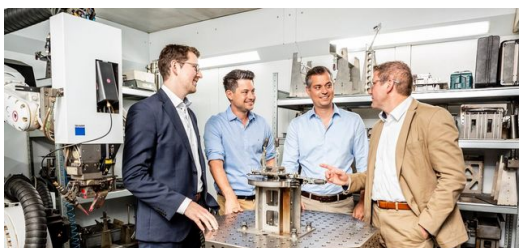
<p>Mit der kompetenten Beratung und Unterstützung ihrer