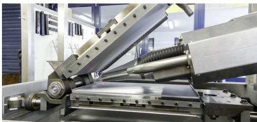
Trotz wenig Platz zwischen den Backplatten reinigt der Laser diese schnell und zuverlässig.