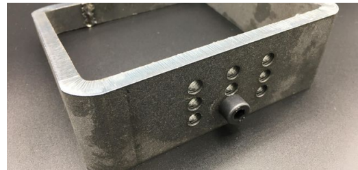
<p>Mit der TruLaser Tube 7000 lassen sich verschiedene Gewinde einbringen.</p>