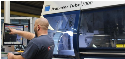
Der Maschinenbediener bekommt das fertige Programm auf sein Terminal, um das Gewinde ins Rohr zu schneiden.