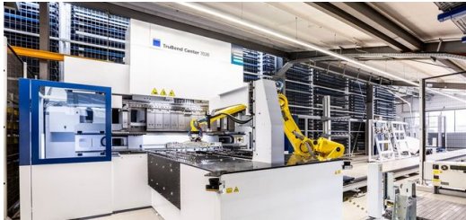
Die TruBend Center 7020 mit Starmatik Roboterautomatisierung ist an das vollautomatische STOPA Lager angeschlossen. Nur für die Bereitstellung neuer und den Abtransport beladener Paletten sind Mitarbeiter notwendig.