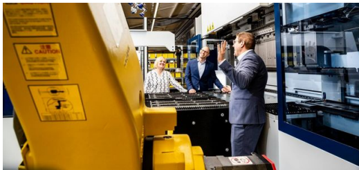
Die Starmatik Roboterautomatisierung zum Be- und Entladen der TruBend Center 7020 bringt Tempo in die Produktion.