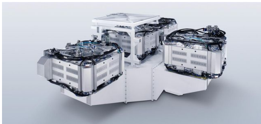
TRUMPF liefert seit Anfang 2014 die dritte Generation seiner Lasersysteme an ASML in den Niederlanden, den einzigen Hersteller von EUV-Lithografieanlagen weltweit.

Und zweitens: Bei 13,5 Nanometern ist es möglich, die für die optische Abbildung notwendigen Schichtsysteme mit ausreichend hoher Reflektivität überhaupt herzustellen. Refraktive Optiken, wie zum Beispiel Linsen, absorbieren diese Wellenlänge. Deswegen arbeiten EUV-Systeme ausschließlich mit Spiegeloptiken. Die sehr kurze Wellenlänge ist auch der Grund, weshalb der ganze Prozess im Vakuum stattfinden muss – Luft würde die EUV-Strahlung ebenfalls absorbieren.