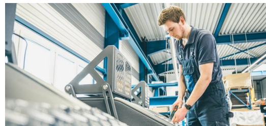
Die Aluminium-Riffelbleche für die EGYM-Geräte schneidet und formt die TruMatic 7000 kratzerfrei und in bester Qualität.