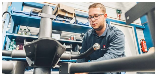
Das Gestänge eines EGYM-Fitnessgeräts besteht aus überwiegend ovalen Stahlrohren. Nach der Bearbeitung auf einer TRUMPF Laser-Rohrschneidemaschine bekommt es durch Pulverbeschichtung ein edles dunkelgraues Finish.

unser fundiertes Know-how im Bereich Laser-Rohrschneiden ganz besonders geholfen.“ Das Gestänge des Geräterahmens besteht zu 70 Prozent aus optisch attraktiven Ovalrohren aus stabilem Baustahl. „Wir setzen zur Bearbeitung sowohl unsere TruLaser Tube 5000 als auch unsere TruLaser Tube 7000 ein. Beide sind mit der Option Schrägschnitt ausgestattet und können Gewinde einbringen.“ Was bei der konventionellen Fertigung nur in mehreren Arbeitsschritten umsetzbar wäre, schaffen die Laser-Rohrschneidmaschinen von TRUMPF in nur einem Arbeitsgang. Das Riffelblech aus Aluminium zum Abstellen der Füße kommt kratzerfrei aus der TruMatic 7000 , die erforderliche Biegekante zur Befestigung am Rahmen erledigt die TruBend 7036 Cell . Die Elektronik sowie einige Kunststoffteile werden Steinhart zugeliefert. Nach der Pulverbeschichtung der Rahmen erfolgt die Montage aller Komponenten zu kompletten Einheiten.