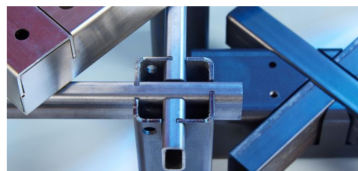
Die TruLaser Tube 7000 schneidet Rohre und Profile mit bis zu 254 Millimeter Hüllkreisdurchmesser. Die komplexe Eckenberechnung rechteckiger Profile leistet die Software TruTops Tube automatisch.