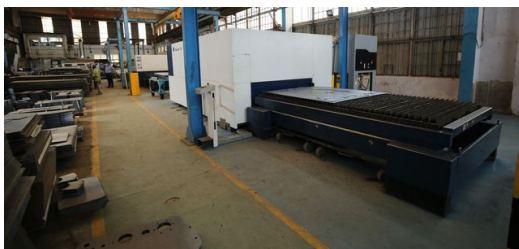
Leichtbau benötigt nicht unbedingt hochfeste Stähle: JBM nutzt diese TruLaser 1030, um Profile für Busse herzustellen.