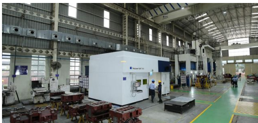
Ursprünglich für den Prototypenbau gekauft, nutzt JBM seine TruLaser Cell 7040 jetzt für das Bearbeiten von Bauteilen aus hochfestem Stahl.