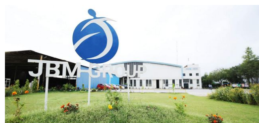
<p>JBM gehört nicht nur zu den größten Automobilzulieferern in Indien, sondern verpflichtet sich der Nachhaltigkeit – auch in Geschäftsbereichen