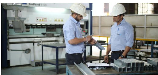
<p>Qualität garantiert: Ingenieure bei JBM inspizieren die Bauteile, die mit der Abkantpresse TruBend 1100 hergestellt wurden. </p>