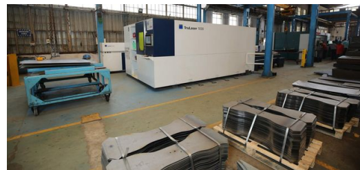
JBM nutzt die TruLaser 1030 Maschinen seit mehreren Jahren für das Schneiden von Blechen.