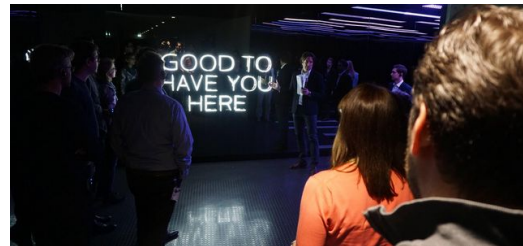
Der Schriftzug im TRUMPF eigenen Tunnelsystem ist in Handarbeit exklusiv für das Unternehmen angefertigt worden. Elektroden regen das Gas im Inneren der Schrift an und bringen sie zum Leuchten.