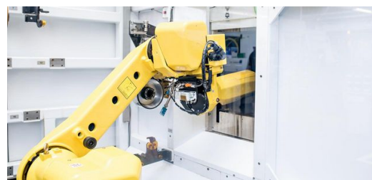
Produktionsstart: Die Reise der Stanzwerkzeuge startet in der Stanzwerkzeugfertigung in Gerlingen, Deutschland.