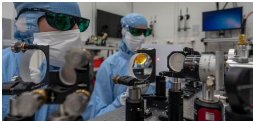
<p>Spiegelaufbau im TRUMPF Reinraum für die Produktion des EUV-Lasersystems.</p>