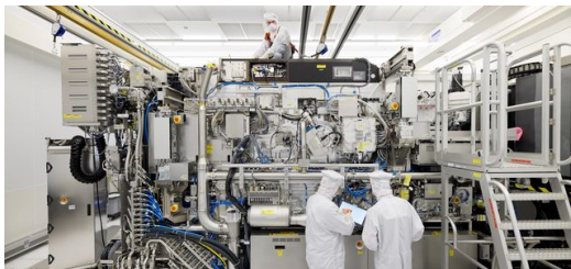
<p>ASML-Mitarbeiter arbeiten an einer neuen Generation des EUV-Lithographiesystems NXE3400B.</p>

Die große Herausforderung bei EUV-Licht ist: es ist schwer zu erzeugen. Denn mit 13,5 Nanometer bewegen wir uns nahezu im atomaren Größenbereich. Um EUV-Licht zu erzeugen, schießt ein Highpower-Laser von TRUMPF in einer Vakuumkammer auf vorbeirauschende Zinntröpfchen – und zwar 50.000 Mal in der Sekunde! Dabei entsteht ein Plasmablitzen mit der gewünschten Wellenlänge von 13,5 Nanometern. Danach fangen Kollektoren das vom Plasma emittierte EUV-Licht ein, bündeln und übergeben es zur Belichtung des Chips an das Lithographiesystem.