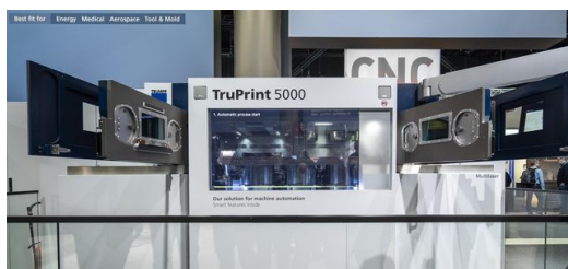
TruPrint 5000 mit automatischem Prozessstart