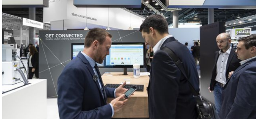
Alle 3D-Drucker des Messestands sind an ein digitales MES angebunden.

Fertigungsmanagementsystem (MES) und eine intelligente Bestellplattform angebunden. Der Anwender lädt die Daten seines Bauteils hoch und erfährt sofort, was sein Auftrag kostet und wie lange die Lieferung dauert. Aber das ist noch nicht alles. Auch der Hersteller kann auf die Prozessdaten der Drucker und die anstehenden Aufträge zuzugreifen. Und zwar von jedem beliebigen Standpunkt aus und in Echtzeit.