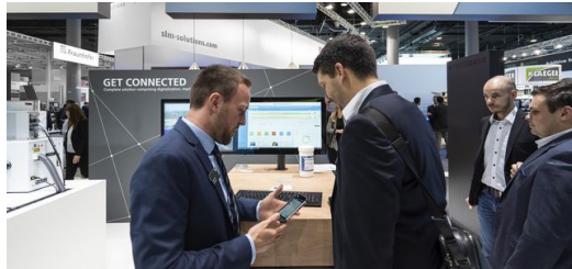
Alle 3D-Drucker des Messestands sind an ein digitales MES angebunden.

Fertigungsmanagementsystem (MES) und eine intelligente Bestellplattform angebunden. Der Anwender lädt die Daten seines Bauteils hoch und erfährt sofort, was sein Auftrag kostet und wie lange die Lieferung dauert. Aber das ist noch nicht alles. Auch der Hersteller kann auf die Prozessdaten der Drucker und die anstehenden Aufträge zuzugreifen. Und zwar von jedem beliebigen Standpunkt aus und in Echtzeit.