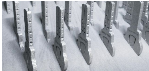
Das 3D-Druck-Verfahren erlaubte es den jungen Ingenieuren von UrbanAlps, die Form von Schlüsseln völlig neu zu denken.

Je besser die Wissenschaft das Laserlicht und seine Wirkungsmechanismen versteht, desto mehr Anwendungsideen und damit Unternehmensideen entstehen daraus. Die neuen Gründer sind – analog zu den berühmten Stanford-Boys im Silicon Valley – oft Postgraduates und Postdocs, die aus ihrer Forschungsarbeit eine Vermarktungsidee ableiten. Und Wagniskapitalgeber sind gerne bereit, hier eine lohnende Investition zu tätigen. Da die Ideen aus der freien Forschung kommen und nicht aus einem engen Anwenderproblem heraus entstehen, sind sie so vielgestaltig wie nie.