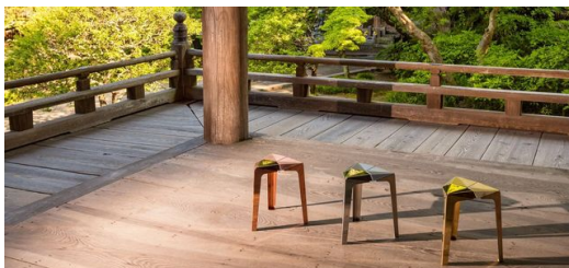
Der Stuhl „Orisu“ ist etwas Besonderes: Er macht abstrakte Technologien für den Betrachter sichtbar.