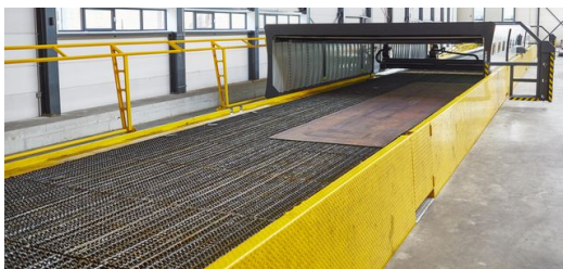
66 Meter ist der Tisch lang. Das reicht nicht nur für die größten Bleche,

Trotz der gigantischen Ausmaße der Anlage reicht ein einziger Mitarbeiter, um sie zu bedienen. Da der Tisch ebenerdig ist, lassen sich die Bleche gut einbringen. „Der Mitarbeiter muss nicht auf einen Bedientisch klettern und kann die Bleche mit einem Deckenkran unkompliziert be- und entladen“, sagt den Oudsten. Ist ein Blech positioniert, klappen an den Seiten Barrieren hoch und eine Kabine fährt heran, die das Blech komplett verdeckt. Sind auf beiden Kabinenseiten die Rolltore heruntergefahren, kann es losgehen.