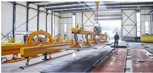
Die „Spanische Schönheit“ schneidet riesige Bleche für Lkw-Karosserien, Schiffswände und den Konstruktionsbau.

Zwei Schneidköpfe tanzen Polka über das Blech und schneiden die gewünschten Formen hinein. Die beiden Optiken sind an einem Portal angebracht, das sich über das Blech in Bearbeitungsrichtung bewegt. Ist ein Blech fertig, öffnen sich die Rolltore und die Vorrichtung bewegt sich weiter zum nächsten. „Mit diesem Prinzip können wir je nach Größe fünf bis zehn Bleche in einem Prozess bearbeiten“, sagt Oudsten.