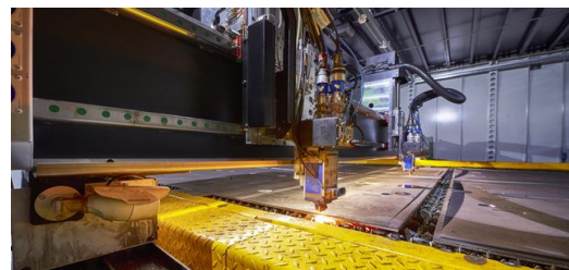
Zwei Schneidköpfe jeweils mit 0,5- und 1-mm-Faser können parallel oder