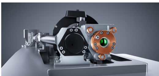
Optikaufbau der neuen TruDisk Scheibenlasergeneration von TRUMPF

Ich war kurz vorher auf einer Konferenz zum Thema Festkörperlaser. In einem Vortrag stand das Medium Ytterbium:YAG im Fokus. Der Referent schwärmte von einem sehr erfolversprechenden Material, aus dem sich Strahlquellen für Hochleistungslaser bauen ließen, wenn—und dieses Problem schien seinerzeit unlösbar—sich das Material nur ausreichend kühlen ließe. Das wiederum ließ mir keine Ruhe mehr.