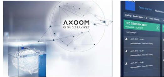
Ein ausgewählter Teil wird über das Internet an die AXOOM Cloud weitergeleitet.