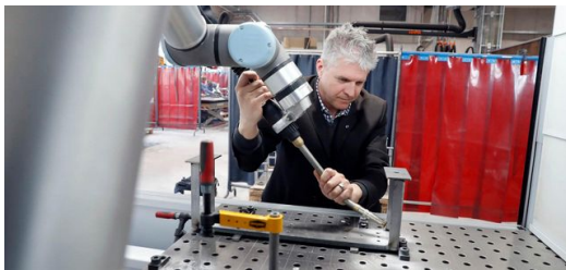
Die TruArc Weld 1000 ist für die Firma zweifel metall ag der Einstieg ins einfache Schweißen.