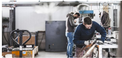
<p>2015 zog IBEX in eine 2.300 Quadratmeter große Produktionshalle mit angeschlossenem Büro in Dresden.</p> – Marlen Mieth