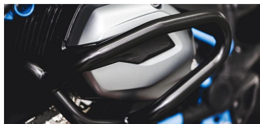
<p>IBEX hat sich das Ziel gesetzt, alles rund ums Motorrad aus Blech zu fertigen. Zum Produktportfolio gehört zum Beispiel dieser Sturzbügel.</p>