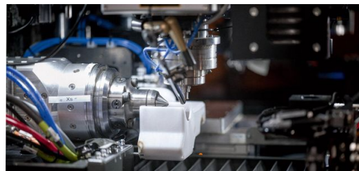
Prinzip des Laserdrehens: Links die luftgelagerte Drehachse, die das Werkstück hält; von oben arbeitet die Trepanieroptik. Das Werkstück rotiert mit 3.500 Umdrehungen pro Minute, der Fokus kreist 30.000-mal pro Minute.