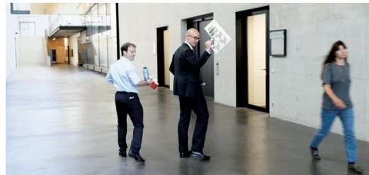
In regelmäßigen Abständen trifft sich das Team aus den Bereichen Baureihe, Entwicklung, Einkauf, Produktion, Vertrieb, Service und Projektorganisation, um die Fortschritte bei der Entwicklung der TruLaser Center 7030 zu besprechen.