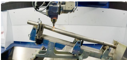
Mit der 3D-Laseranlage TruLaser Cell 8030 von TRUMPF lassen sich präzise Konturen ausschneiden, die vor dem Biegen nicht eingebracht werden können, weil sie sich sonst verformen würden.