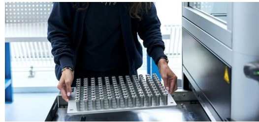
Die Automatisierungszelle ist mit vier Schubladen ausgestattet. 960 Bauteile haben darin Platz. Sie werden parallel zum Schweißprozess be- und entladen.