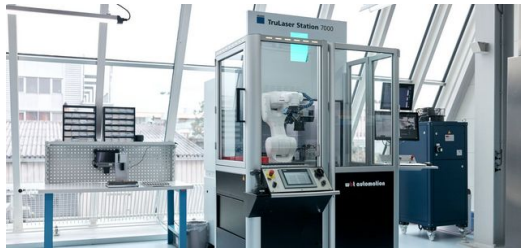
Effizientes Duo: Am schweizerischen Standort Widnau schweißt der Endoskop-Hersteller Karl Storz Okulare auf einer TruLaser Station 7000. Eine mobile Roboterzelle übernimmt das Be- und Entladen der Bauteile.