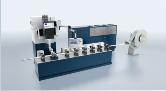
Fertigen am laufenden Band: die Anlage für Profis im Endlosschweißen.

Machen Sie sich das Leben einfach: Die kompakte und modulare TruLaser Cell 1100 lässt sich ganz einfach in Ihre Bearbeitungslinien integrieren. Sie konfigurieren das Strahlführungssystem nach Ihren individuellen Bedürfnissen: egal ob Hub der Linearachsen, Arbeitshöhe oder Verfahrenswege. Damit ist es auch möglich, gleichzeitig an zwei unterschiedlichen Stellen zu schweißen.