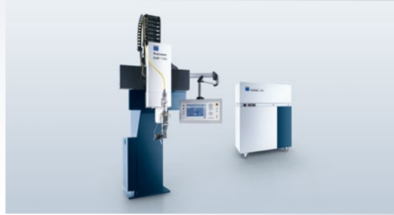
Mit neuester Prozesstechnologie für anspruchsvolle Aufgaben gerüstet.

Die variablen Verstellachsen bieten ideale Einstellmöglichkeiten sowohl für Rohre als auch für Profile. Die flexible Strahlführung kann aufgrund der kompakten Bauweise in alle gängigen Profilieranlagen integriert werden. Die ausgeklügelte Strahlformung ermöglicht für unterschiedlichste Nahtgeometrien eine optimale Schweißnahtqualität bei maximalen Vorschüben und höchsten Anforderungen.